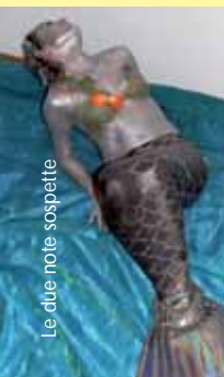
Le due note sospette