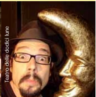
Teatro delle dodici lune