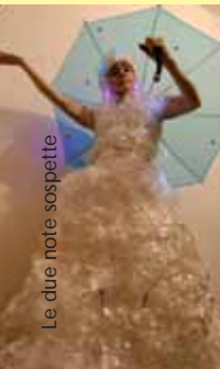
Le due note sospette