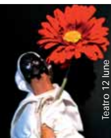
Teatro 12 lune

Libera Accademia di Belle Arti di Firenze "Workshop di fotografia"