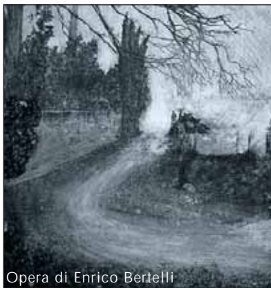
Opera di Enrico Bertelli

Enrico Bertelli giovane artista di Montelupo Fiorentino, diplomato in "tecniche grafiche speciali" all'Accademia di Belle Arti di Firenze con il massimo dei voti. Alcune sue opere sono conservate presso l'archivio del museo d'arte contemporanea "Villa Renatico Martini" a Monsummano e presso l'archivio della Fundacion CIEC a La Coruna.