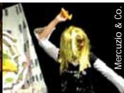
Mercuzio & Co.