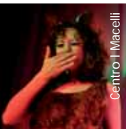
Centro I Macelli