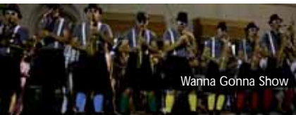
Wanna Gonna Show